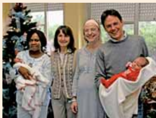
Il Sindaco con i primi nati del 2009

D a quest'anno tutte le coppie di genitori residenti a Senigallia riceveranno, subito dopo la nascita del proprio figlio, una lettera da parte del Comune che li informa sui vari servizi per l'infanzia esistenti in città.