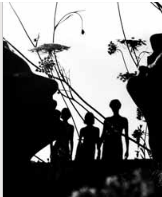
Lorenzo Cicconi Massi, dalla serie "Un altro mondo" 1999

Cauta vagliai la mia piccola vita e separai l'effimero da ciò che durerà finché vi sia chi - come me - sia costretto a sognare.