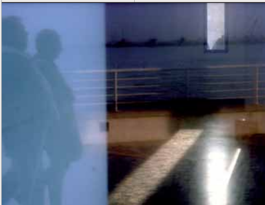
Lo scatto vincitore dell'edizione 2008 del concorso fotografico