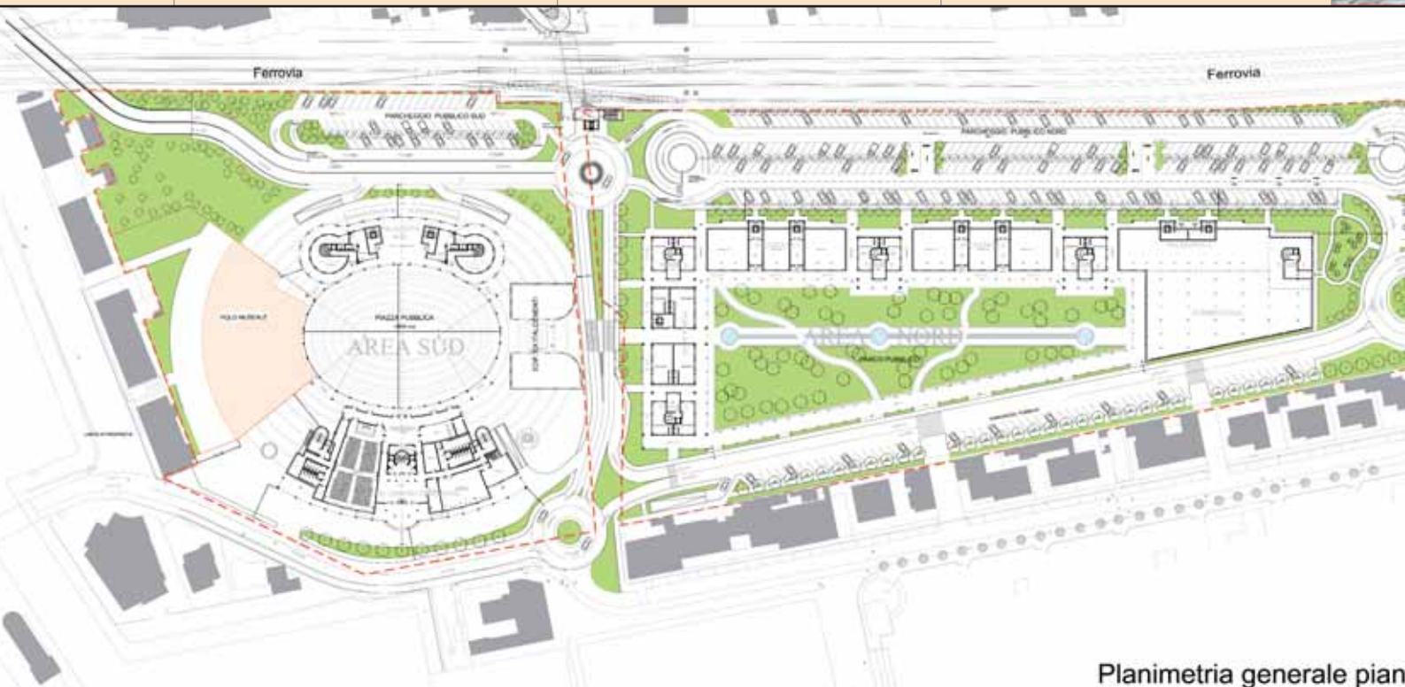
Planimetria generale pian