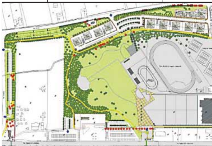
Il progetto del Parco delle Saline

Significativi anche gli interventi del Comune nell'edilizia economica popolare, con il convenzionamento per il Peep di via Piave (36 alloggi) con la redazione e approvazione del Peep del Cesano (90 alloggi) e con la redazione del programma di recupero urba-