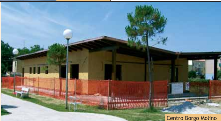
Centro Borgo Molino

■ Costruzione del prefabbricato Data consegna lavori: 30.05.2005 Importo lavori: € 245.000