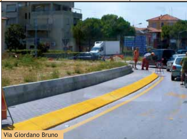
Via Giordano Bruno

Principali interventi: ■ Miglioramento dell'assetto stradale e della viabilità ■ Impianti di irrigazione ■ Illuminazione Data consegna lavori: 27.06.2005 Importo lavori: € 701.000