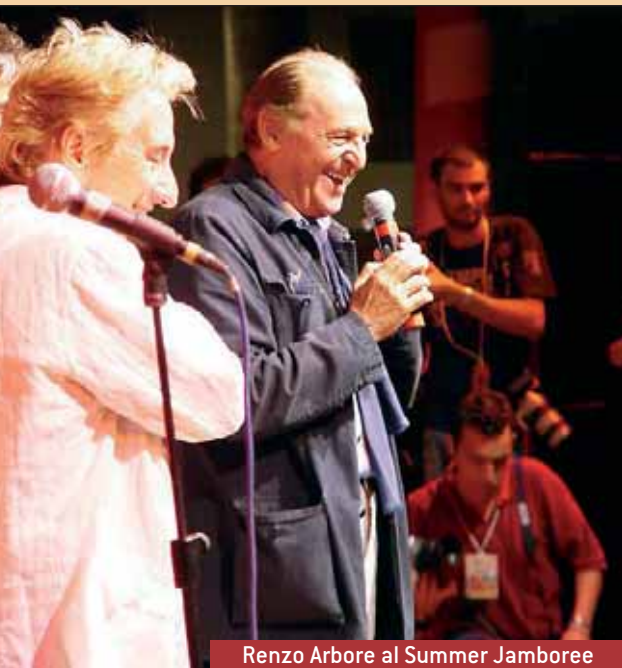
Renzo Arbore al Summer Jamboree