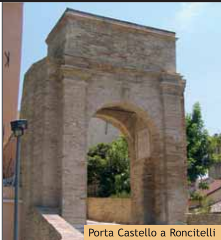
Porta Castello a Roncitelli

Principali interventi: ■ Restauro Monumentale della Porta Civica ■ Realizzazione della nuova pavimentazione ■ Ripavimentazione della piazza principale del castello ■ Illuminazione Importo lavori: € 232.799