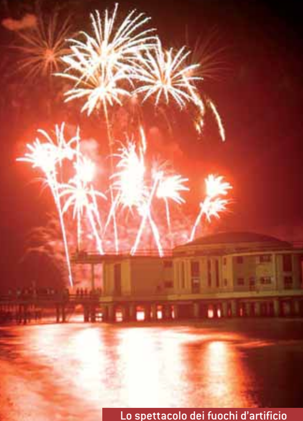
Lo spettacolo dei fuochi d'artificio

Le migliori immagini della stagione 2005