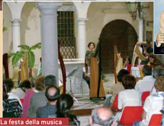
La festa della musica