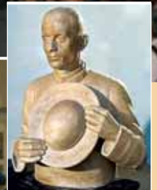
Un'opera di Ceccarelli per la mostra "Scultori del '900"