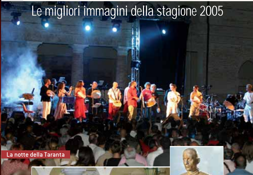
La notte della Taranta