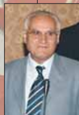
Fiore Bittoni Gruppo Misto