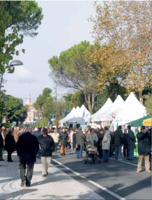
Corso Matteotti il giorno dell'inaugurazione

I l salotto cittadino si estende. Il Corso 2 giugno, cuore pulsante della città e luogo di incontro e di animazione commerciale, vede ormai come sua naturale prosecuzione Via Carducci e Corso Matteotti, nelle loro nuove vesti acquisite al termine dei lavori di sistemazione e riqualificazione.