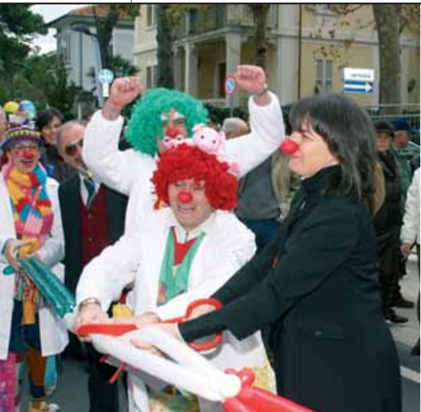
Il sindaco coinvolto nella gioiosa atmosfera inaugurale

I senigalliesi avranno in questo modo l'opportunità di fare una lunga e bella passeggiata lungo queste rinnovate vie del centro storico, tutte di grande pregio estetico e monumentale. Una passeggiata che potrà partire da Porta Lambertina e arrivare sino alla Chiesa del Portone, attraversando appunto Via Carducci, Corso 2 giugno e Corso Matteotti.