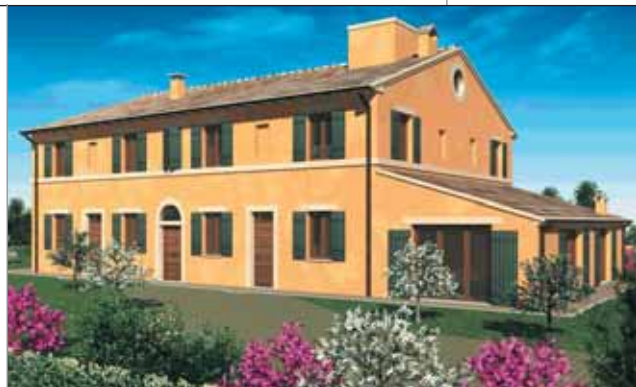
La residenza del Rosciolo

Essi potranno così usufruire di un intervento che garantisca assistenza e crei le condizioni per una