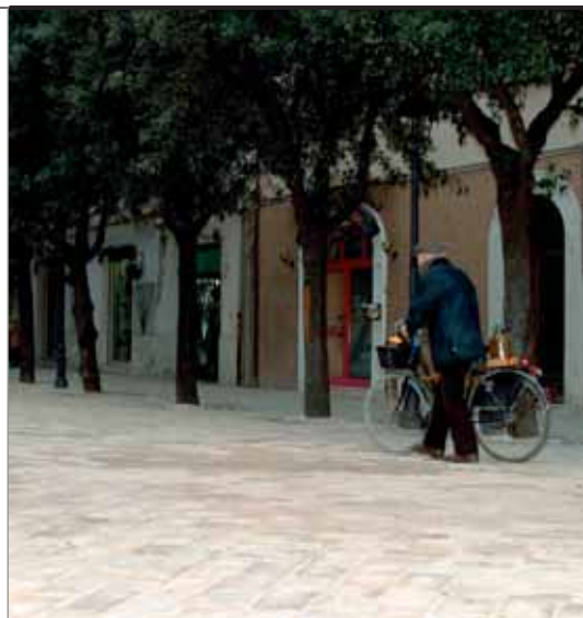
La nuova pavimentazione di via Carducci

Lungo Corso Matteotti sono state messe a dimora trenta piante ornamentali di peri da fiore, che raggiungeranno un'altezza compresa tra 10 e 15 metri. Si tratta di alberi caratterizzati da un'abbondante fioritura primaverile con fiori bianchi e senza frutti. Il loro profondo apparato radicale non rischierà di sollevare la massicciata stradale. Il pero da fiore è uno degli alberi che meglio si adattano alla vita dei centri abitati. Quando siamo stati costretti a procedere all'abbattimento delle piante situate in Corso Matteotti poiché costituivano un pericolo per la pubblica incolumità, avevamo assunto l'impegno di mettere a dimora il doppio del numero di alberi abbattuti. Ed è appunto ciò che abbiamo fatto.