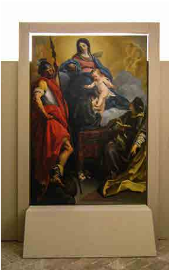
Sotto un'altra luce