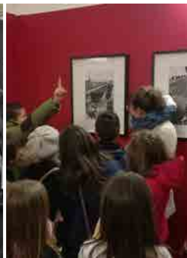
Les Temps Retrouvè - Doisneau