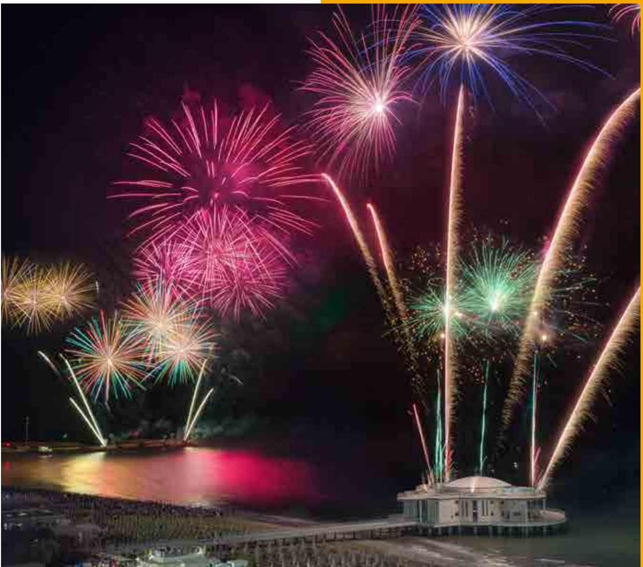
Notte della Rotonda