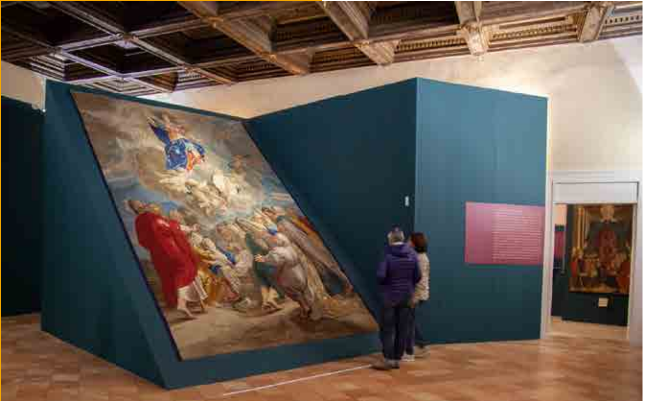
Maria Mater Misericordiae