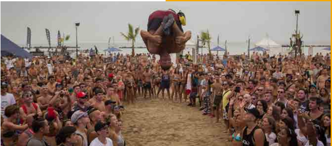
Senigallia X Masters