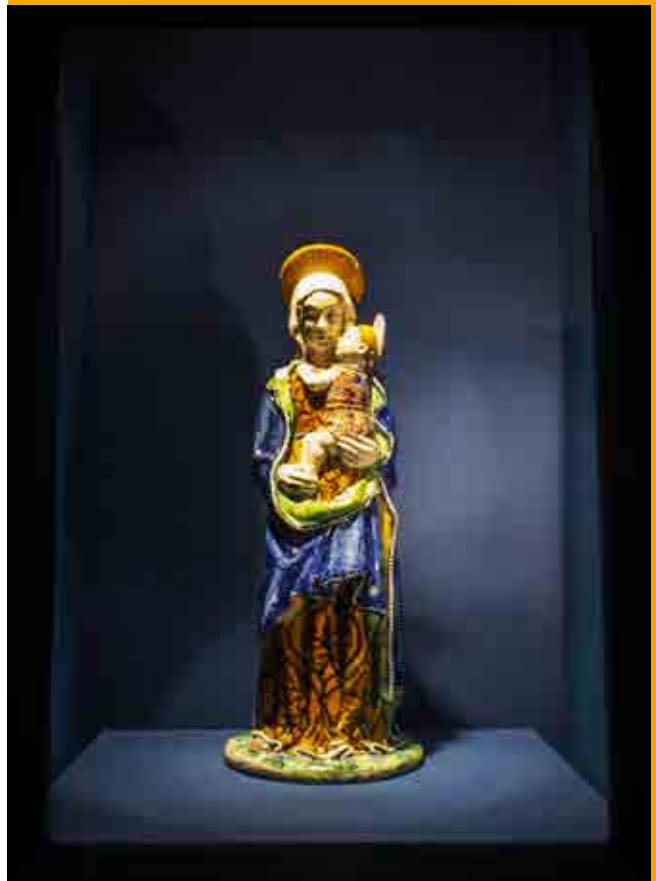
Lacrime di smalto