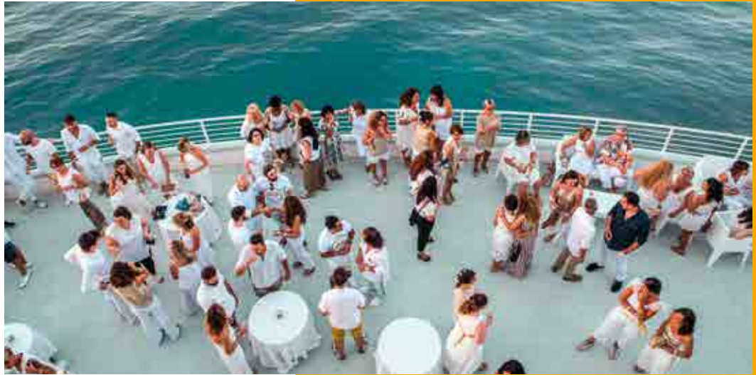
Rotonda a Mare