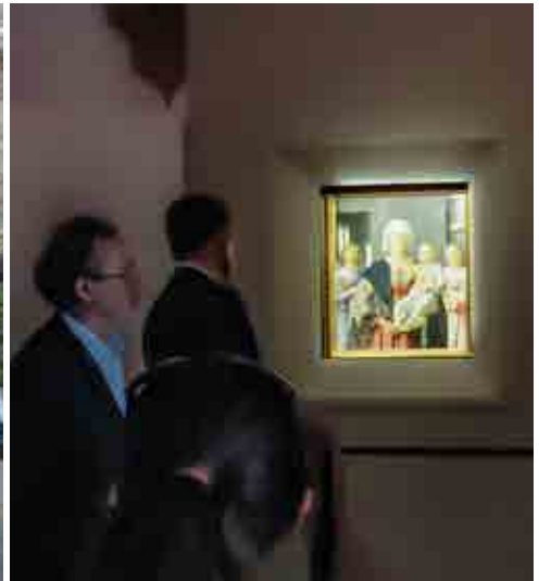
La Luce e il Mistero