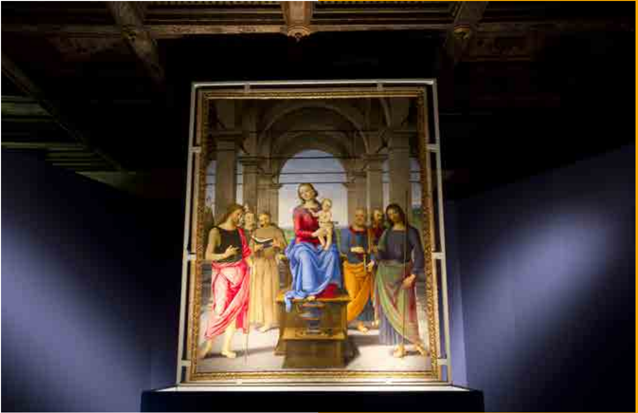
La Grazia e la Luce