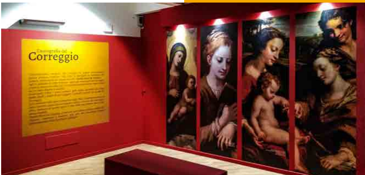
Il Correggio ritrovato