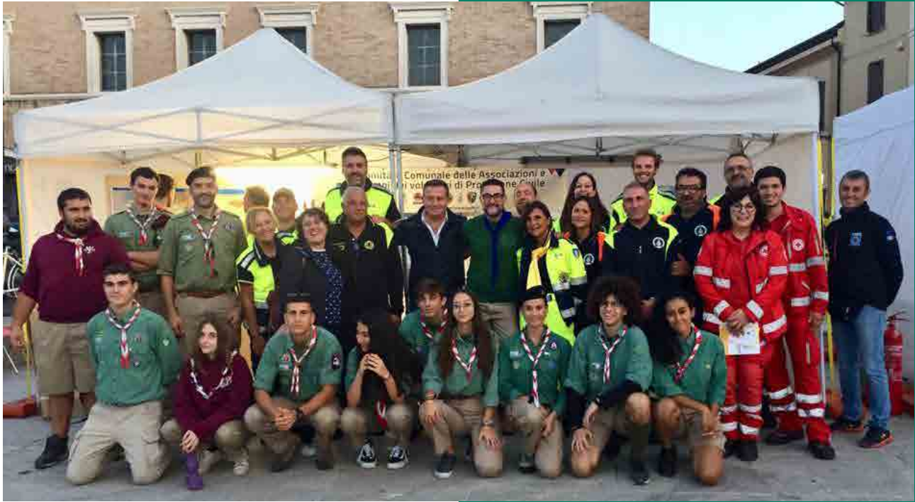
Comitato volontari Evento "Io non rischio"