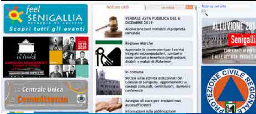
Sito Web istituzionale