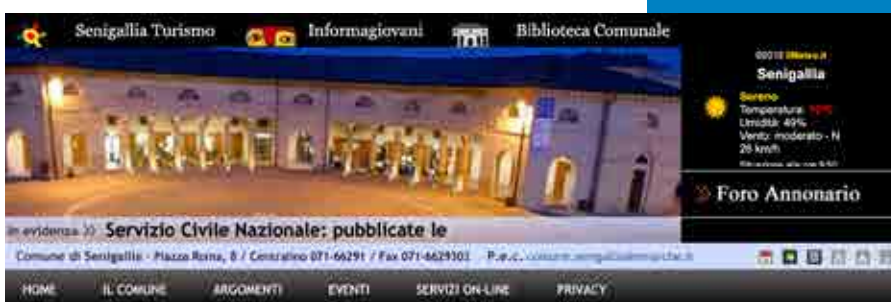
Sito Web Open Municipio